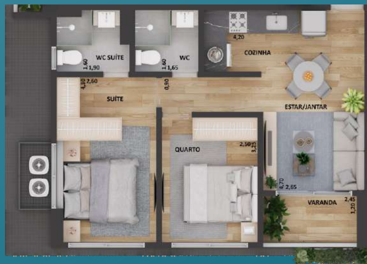
04 STUDIO COM 53,08 M 2