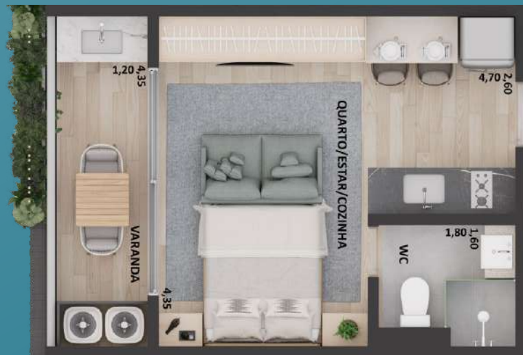
03 STUDIO COM 28,58 M 2