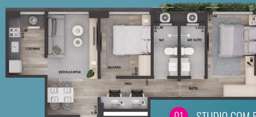
01 STUDIO COM 57,98 M 2