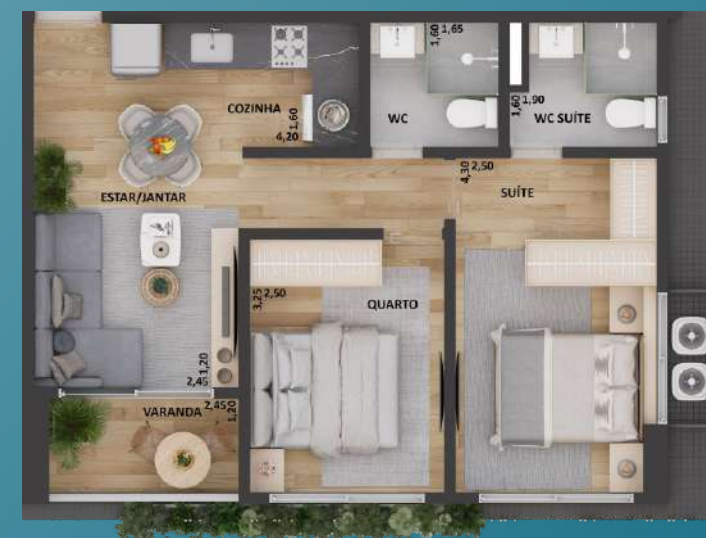
02 STUDIO COM 53,61 M 2