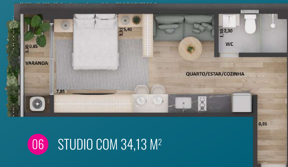
06 STUDIO COM 34,13 M 2